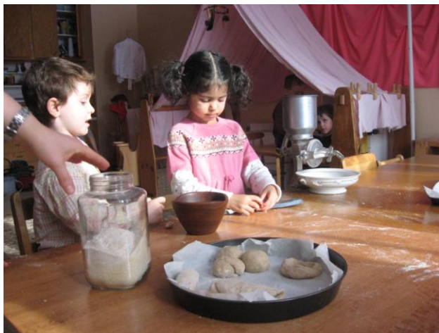
Photo tirée d'une vidéo du projet Zoom sur les pratiques alimentaires