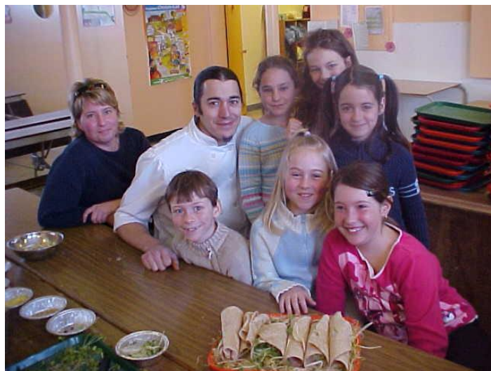
Atelier du goût – École St-Luc