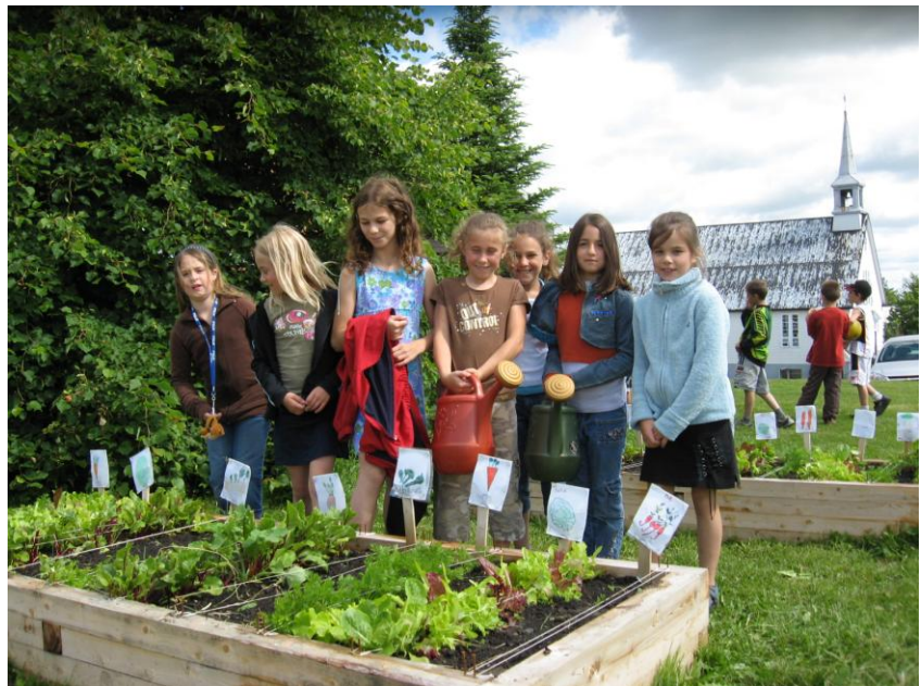
Potager à l'école St-Luc

À l'automne, les responsables du service alimentaire des 3 CPE et d'une école sont rencontrés par la coordonnatrice du programme et une nutritionniste pour présenter le programme et faire un bilan de l'offre alimentaire de l'établissement.