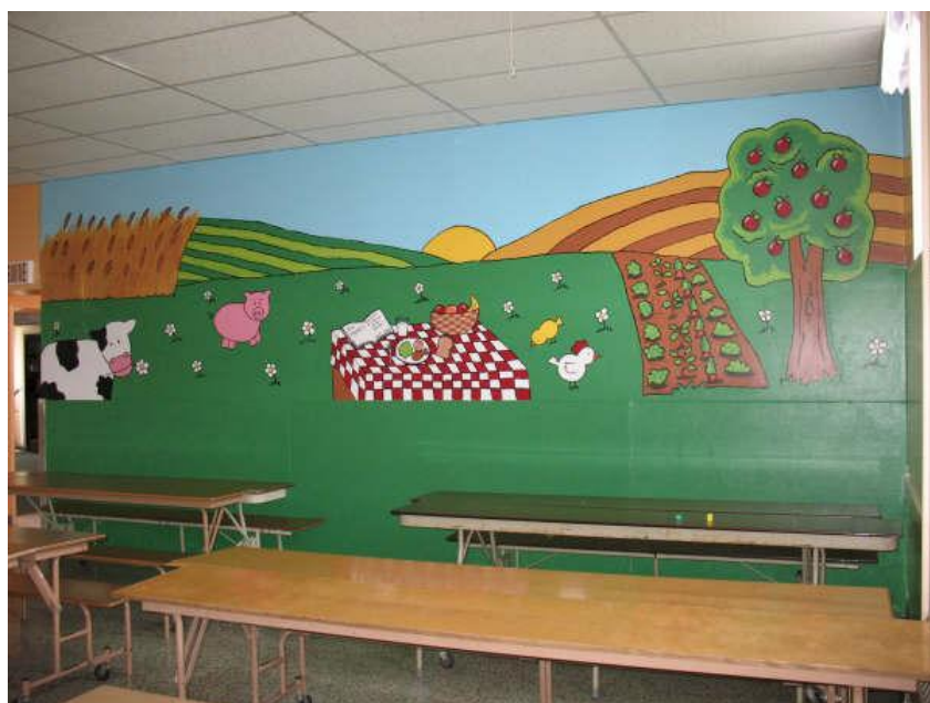
Murale de la caf t ria r alis e par des enfants –  cole St-Luc