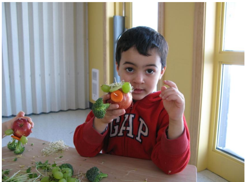
Atelier du goût - CPE Le P'tit Gadu