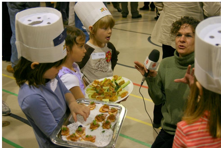
Entrevue lors du lancement du programme Un trésor dans mon jardin

Nouvelles de Radio-Canada à 18 heures, Le lancement du programme Un trésor dans mon jardin RC – 16 mai 2007