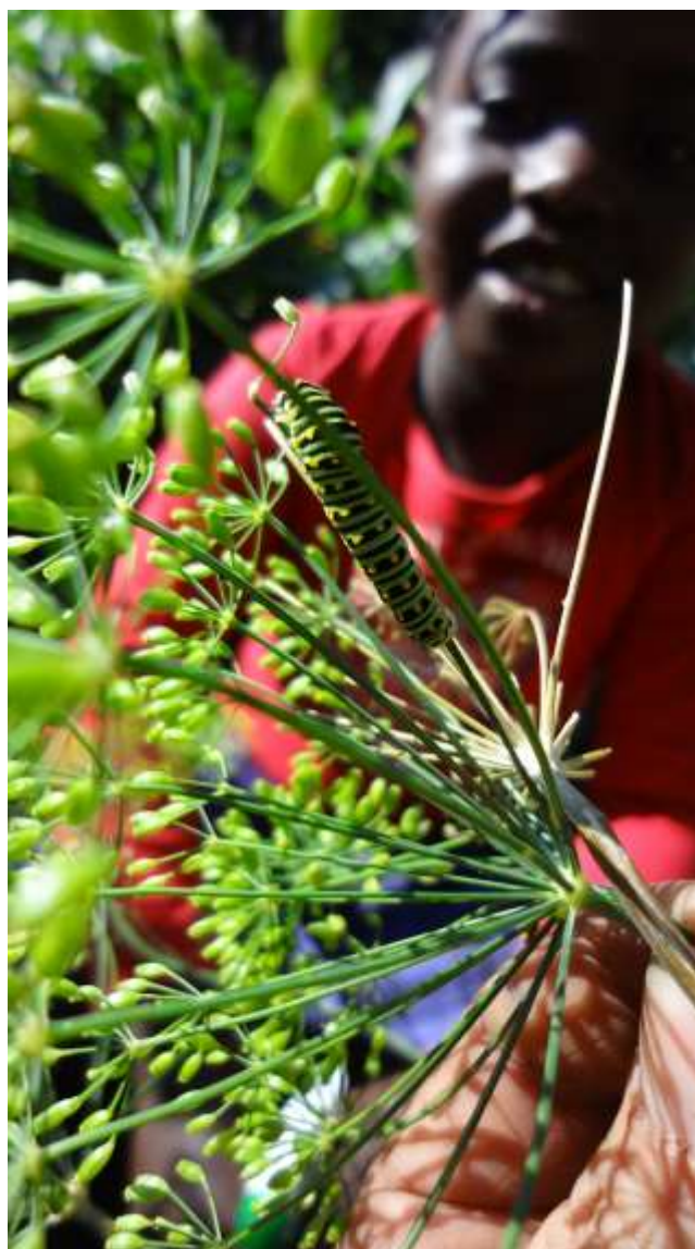
Récolte d'aneth et exploration d'insectes Place Goupil-Triest