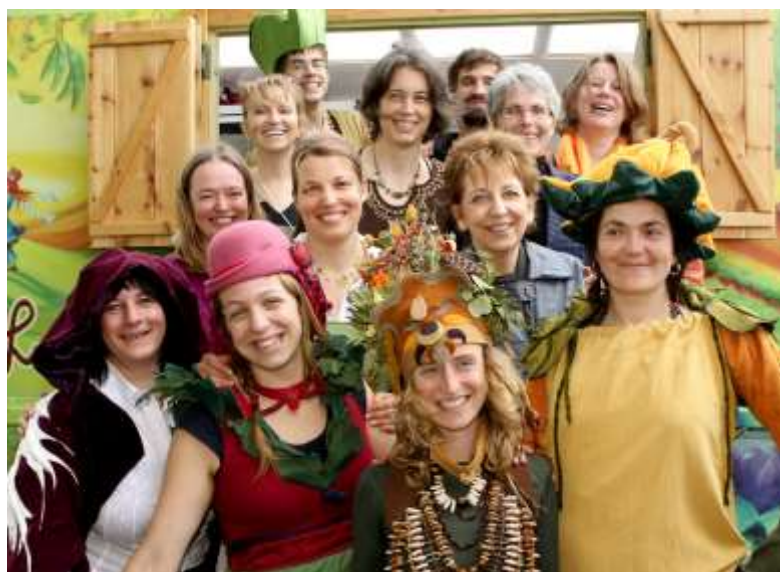
Équipe de Jeunes pousses et quelques costumes de la caravane