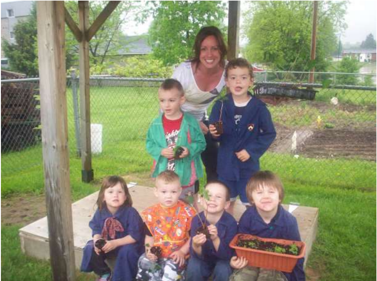
Le temps des semis à la maison de la famille de Cowansville

Ainsi les enfants sont quotidiennement amenés à renouer avec l'origine des aliments, à comprendre l'importance de la production agricole locale, à découvrir les plaisirs de socialiser autour de la nourriture, à éveiller leurs goûts en utilisant leurs 5 sens, à écouter leurs signaux de faim et de satiété et à prendre plaisir à bien se nourrir pour favoriser leur développement physique et mental. Par son action, Jeunes pousses souhaite donc redonner à l'enfant des repères alimentaires et culinaires par le biais de l'exploration et d'expériences concrètes et lui offrir un héritage précieux qui le suivra toute sa vie.