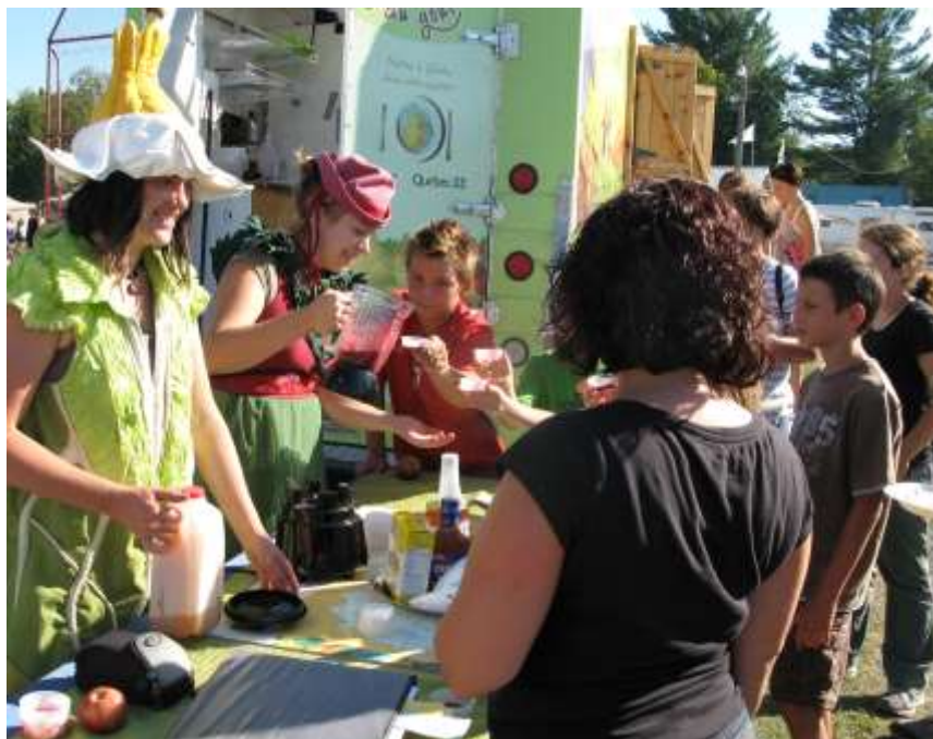
La Caravane du goût aux Comptonales, Compton