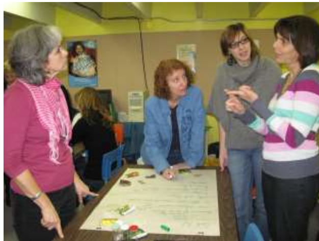
Formation des enseignants Brome-Missisquoi

Le suivi et l'accompagnement à distance et sous différentes formes ont été expérimentés, soit directement avec des établissements ou par l'entremise d'une coordonnatrice d'un regroupement local de partenaires. Les contraintes de temps des intervenants posent un défi certain à Jeunes pousses et demande beaucoup de flexibilité afin d'assurer des rétroactions régulières.