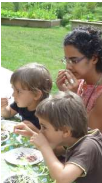
Atelier d'éveil au goût, Villa Pierrot

C'est avec beaucoup de plaisir que les enfants et les parents s'ouvrent à de nouvelles variétés d'aliments et qu'ils apprennent à mieux se connaître comme mangeurs. L'enthousiasme est palpable et déjà on remarque plein de nouveaux mots dans la bouche des enfants! À suivre en 2011-2012!