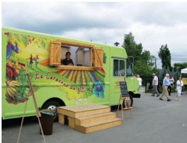
La Caravane du goût