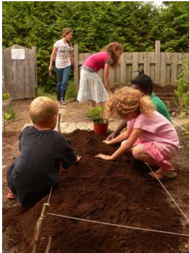
Potager, Place Goupil-Triest

More and more milieux are showing interest in the training and the material intended for community milieux. The organization has been able to observe through these three concrete experiences that the potential for sustainability and appropriation by the milieux is great. In this sense, the conception of the material intended for the community volet should be completed during the next year. Jeunes pousses is planning the start of the trainings intended for the milieux of the community in February 2012.