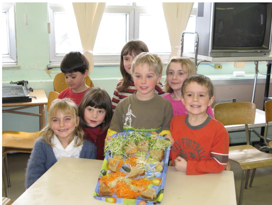
Atelier d'éveil au goût, École Sacré-Cœur , Coaticook

Au printemps 2007, l'équipe travaille assidûment à la conception du site Internet qui devra être en ligne en mai 2007, à l'occasion du lancement officiel du programme Un trésor dans mon jardin .