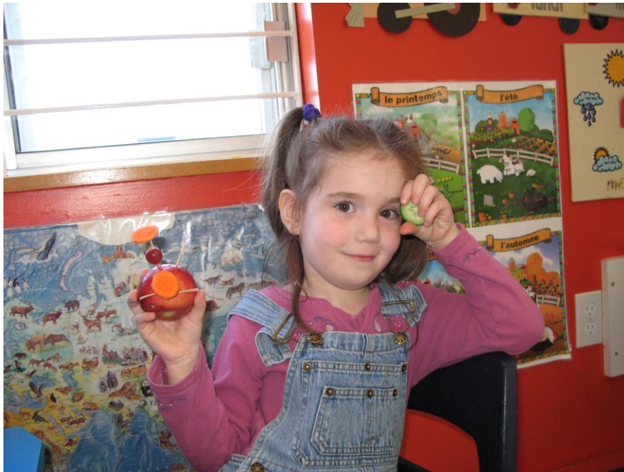
Atelier d'éveil au goût, CPE La pleine lune, Magog