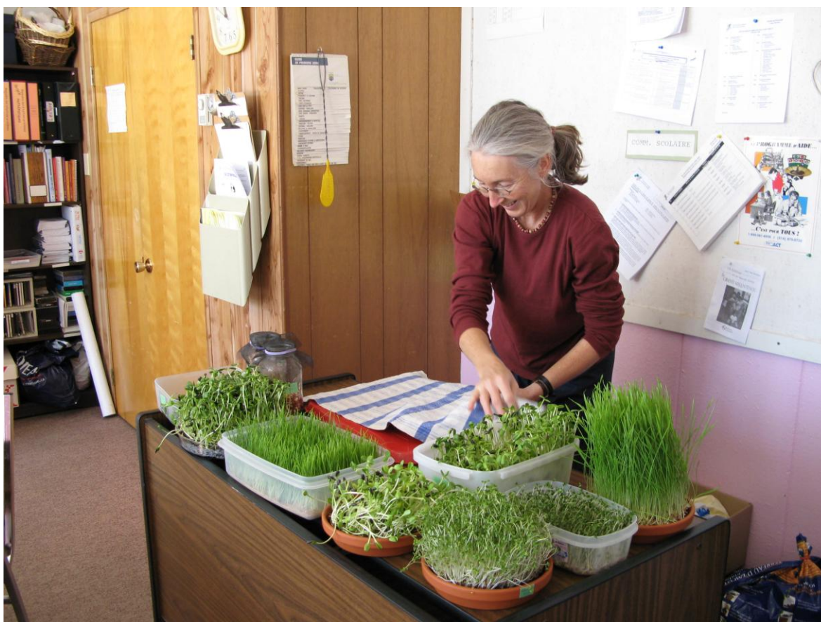
Formation sur la germination, École St-Luc, Barnston

9 mars 2007 : Ateliers du goût 2007/1 : germinations, 2 groupes jumelés 3-4 ans